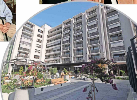
La nueva residencia El Rodeo se ubica en Avenida La Dehesa, en la comuna de Lo Barnechea.