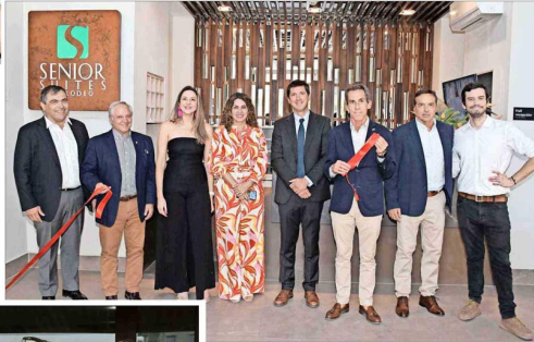
El corte de cinta de la inauguración de la nueva residencia de Senior Suites.