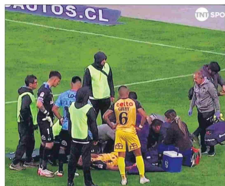
Momentos de alta tensión se vivieron en el estadio El Teniente y Mettifogo fue retirado en ambulancia.

hombre, pero es calladito, de bajo perfil".