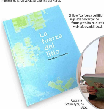
El libro "La fuerza del litio" se puede descargar de forma gratuita en el sitio web lafuerzadelitio.cl