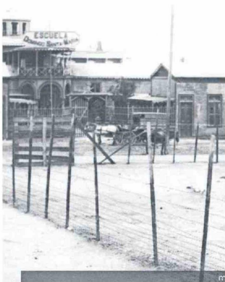
LA ESCUELA SANTA MARIA.