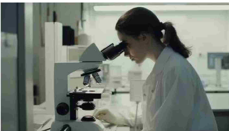
La OMS está estableciendo un Consorcio para la Investigación Colaborativa y Abierta (CICA) para cada familia de patógenos, con centros colaboradores como base de investigación, en colaboración con instituciones de investigación de todo el mundo.

giamientación, expertos en ensayos y otros, con el objetivo de promover una mayor colaboración en la investigación y una participación equitativa, especialmente en lugares donde se sabe que circulan patógenos, o