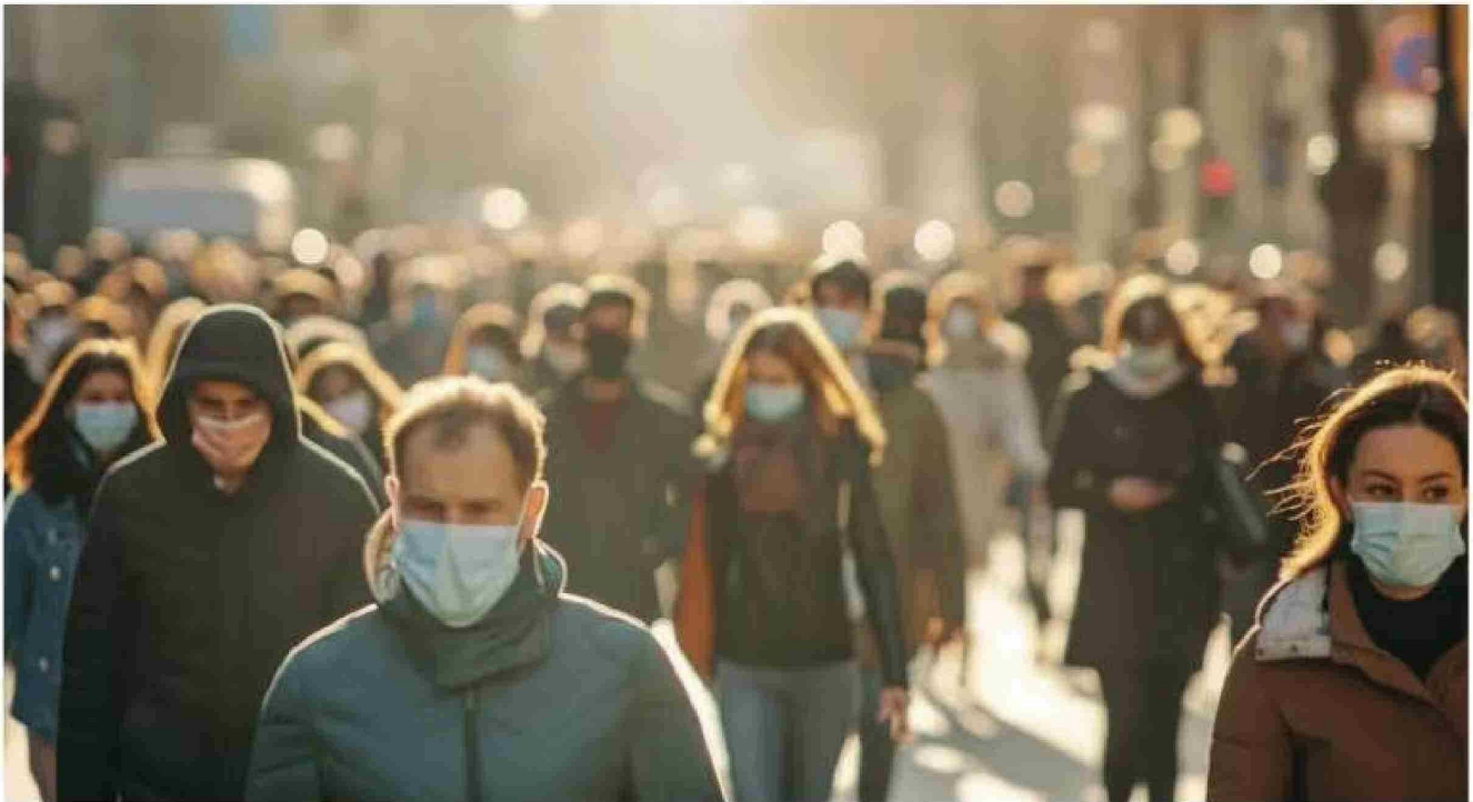
Los expertos estudiaron 28 familias de virus para determinar el riesgo epidémico y pandémico basándose en la transmisión, la virulencia y la disponibilidad de pruebas diagnósticas, vacunas y tratamientos.