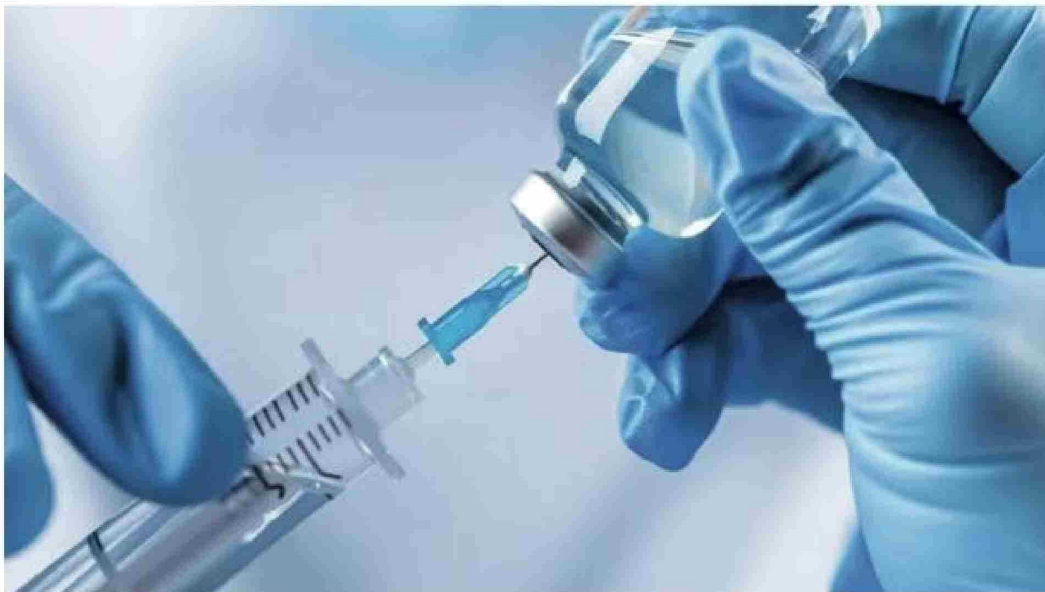
Utilizar prototipos de patógenos como guías para establecer la base de conocimientos de familias enteras de patógenos es una propuesta de la OMS y la CEPI.

Al tiempo que enfatizaron: "En estos CICA participarán investigadores, desarrolladores, entidades de financiación, organismos de re-