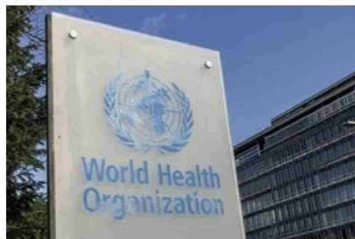
"Este proceso destacó la naturaleza imperativa de los esfuerzos de colaboración para lograr resiliencia global contra epidemias y pandemias", planteó la OMS en el comunicado.