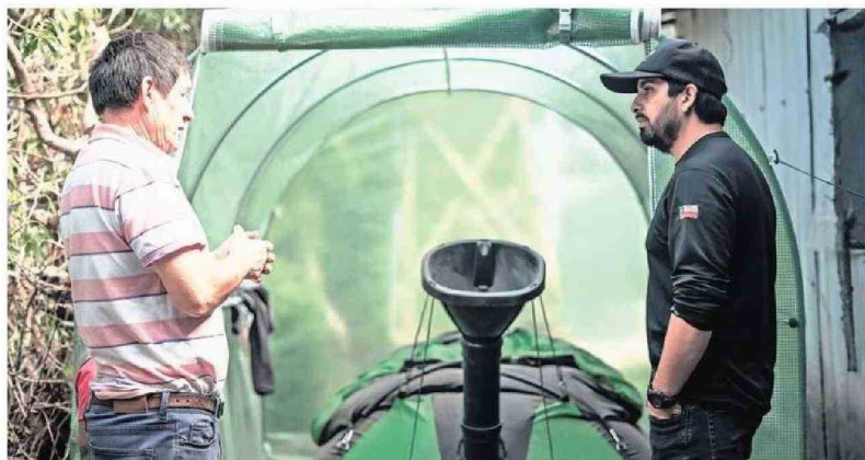
INVERNADEROS CON RIEGO TECNIFICADO FUE OTRO DE LOS AVANCES QUE EL PROYECTO INSTALÓ EN LA ISLA.

Para la finalización de este programa, se llevaron a cabo capacitaciones de fomento productivo a las familias e instituciones beneficiarias, con la finalidad de otorgar competencias y guiar en aspectos productivos al territorio.