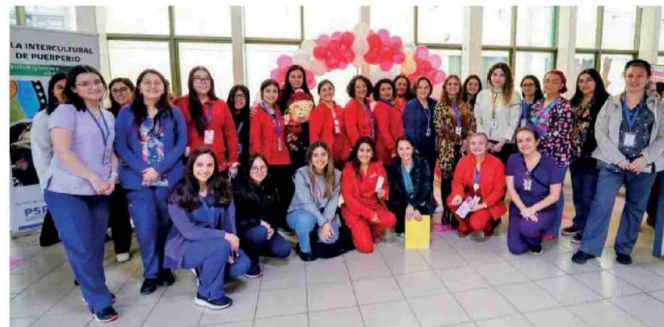
LACTANCIA MATERNA, episodio 21 de la segunda temporada del podcast "Hagamos Salud".

Por su parte, la matrona supervisora de Puerperio comentó como se apoya desde el área de la salud a las madres, con quienes "se favorece este contacto piel a piel de forma inmediata e interrumpida tras el parto, esto porque favorece el inicio espontáneo de la lactancia materna. También en puerperio se favorece el alojamiento conjunto, esto quiere decir que la madre permanece junto a su recién nacido durante toda la hospitalización. Se cuenta con una clínica de lactancia para