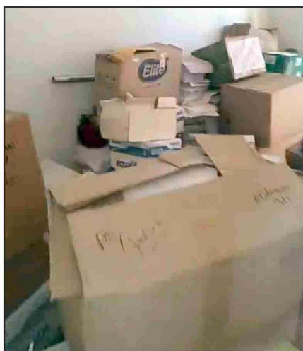
Lugar donde escondían el implemento de baile, posterior a la fiscalización según quien realiza la denuncia.

Diario El Trabajo asistió a las oficinas del programa privado en cuestión para conocer el motivo de la intervención indebida por parte de la directora; sin embargo, funcionarios del lugar señalaron que se encontraba con licencia médica.