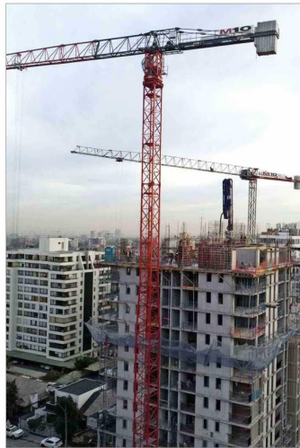
La proyección de crecimiento de la CPC para este año se sitúa en el rango de 2,25% y 2,75%.

Pese a las mejores condiciones externas y un gradual repunte del consumo privado, en la CPC remarcan que una de las principales preocupaciones que frenan un mayor impulso de la actividad es la negativa evolución de la inversión, arrastrada por un escenario marcado por la incertidumbre ligada principalmente a factores internos. Se destacó que la inversión volvió a contraerse con fuerza en el primer trimestre, profundizando la caída del segundo semestre de 2023. La formación bruta de capital fijo se hundió 6,1% en el primer trimestre, el peor desempeño desde fines de 2020 y sumando tres caídas anuales consecutivas. Así, la entidad espera que la inversión se contraiga un 1% en 2024. "Condiciones crediticias más estrictas, tasas de largo plazo persistentemente más altas y amenazas de aumentos en los