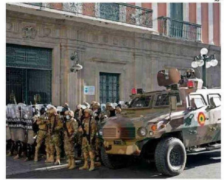
MILITARES IRRUMPIERON EN CARROS BLINDADOS EN LA PAZ.