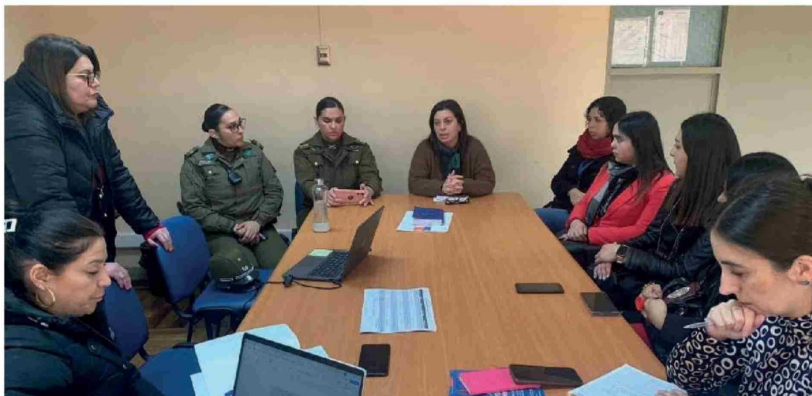
EL CIRCUITO INTERSECTORIAL DE FEMICIDIO sesionó en dependencias de la Delegación Presidencial Provincial de Biobío.

comunidades, para prevenir la violencia, sancionar, acompañar a las víctimas de violencia y, por supuesto, erradicarla.