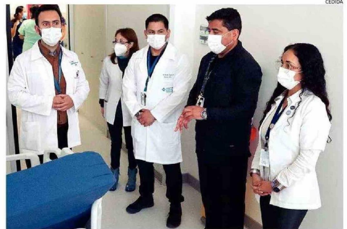
AUTORIDADES DEL SECTOR SALUD VISITARON LAS UNIDADES CRÍTICAS DEL HOSPITAL REGIONAL.

La vacunación sigue siendo el proceso más importante según las autoridades de salud, a pesar de ello, a nivel regional existe un 70% de cobertura de vacunación por influenza, dio a conocer la seremi de Salud, Jesús-