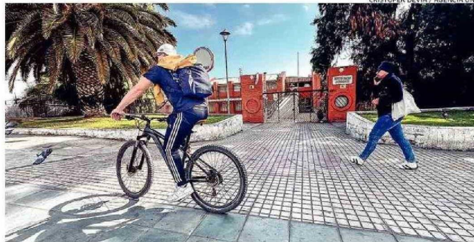
EL EDIFICIO QUE UTILIZÓ LA TELETÓN FUE COMPRADO DURANTE ESTE AÑO.