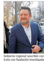
Gobierno regional suscribió contrato con fundación investigada.

Cómo la arista Procuratura del caso Convenios vuelve a complicar a Claudio Orrego | C 6