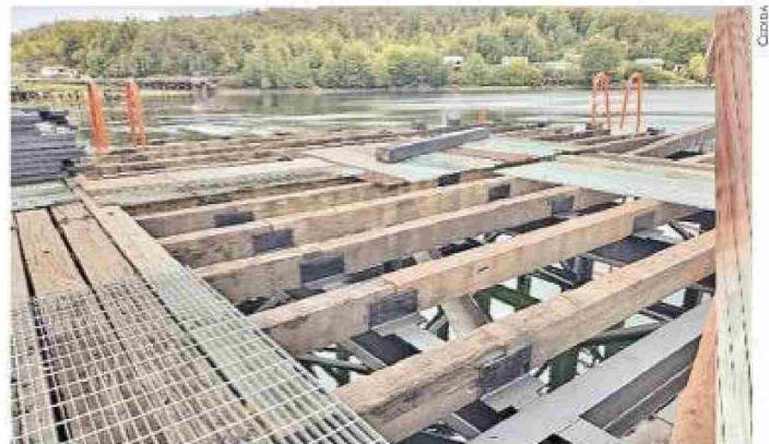
Durante 2024 se trabajó en el mejoramiento del muelle de Puerto Edén.