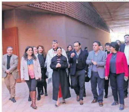
LAS AUTORIDADES RECORRIERON EL MUSEO.

áreas para convenciones, laboratorios, y un auditorio. Se espera que exponga alrededor de 2.000 objetos, en comparación con los 300 que se exhiben actualmente en el museo existente.