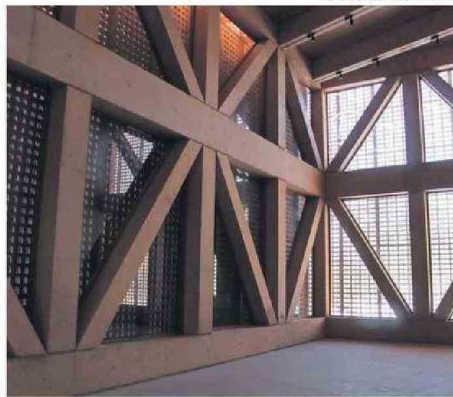
LA ARQUITECTURA BUSCA EVOCAR PAISAJES DE ATACAMA.

El museo tendrá una infraestructura moderna y sostenible, con espacios flexibles diseñados para exhibiciones permanentes y temporales. Contará con siete salas de exhibición dedicadas a temas como geografía, geología, paleontología, y biodiversidad marina. Además, incluirá una biblioteca,