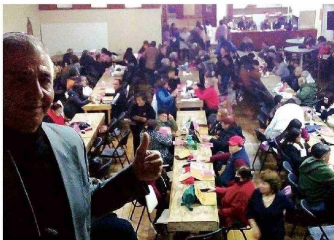
EL CANTANTE QUE TRAE ÉXITOS DEL AYER, PARTICIPÓ PARTICIPANDO EN BENEFICIOS JUNTO A UNA AGRUPACIÓN. HOY SIGUE COLABORANDO EN ESTAS ACTIVIDADES EN SOLITARIO.

-Me acuerdo mucho de Buddy Richards, Sandro, José Alfredo Fuentes, Wildo, Adamo y Leonardo Fabio. Son temas lindos que marcaron una época en la música y eso no va a morir nunca, porque incluso hay niños que cantan esos temas.