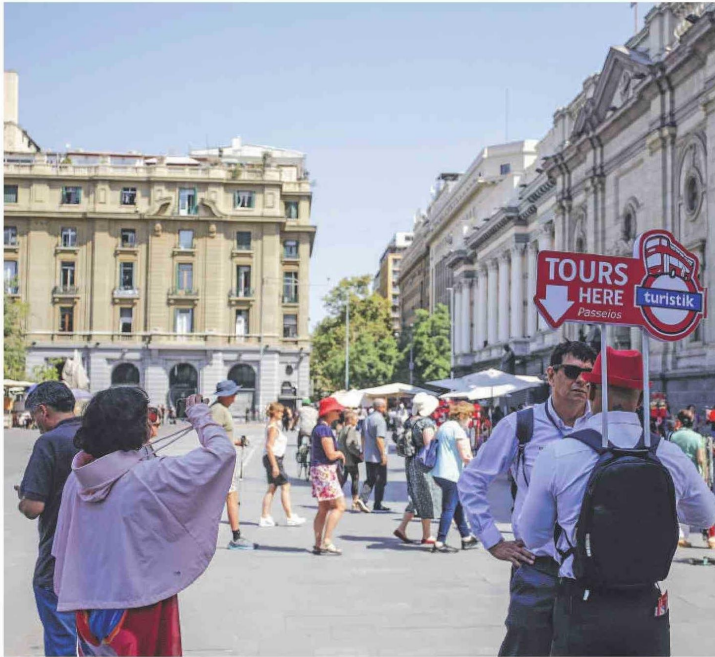
Turistas en la Plaza de Armas de Santiago.

Inversiones y trabajo conjunto han permitido que más turistas dejen millones en cada recalada en puertos chilenos.