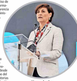
Ximena Aguilera, ministra de Salud.

En la instancia, un espacio de encuentro y diálogo del ecosistema de salud, Alejandro Ferreiro, presidente de Chile Transparente, felicitó a la Cámara de Innovación Farmacéutica (CIF Chile) por la promoción de buenas prácticas, "no desde la inercia y la conformidad, sino del cambio disruptivo en estas materias para potenciar no solo la reputación, sino la relación de esta industria con la ciudadanía".