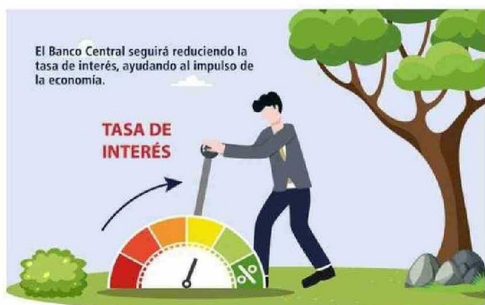
CON ESTAS IMÁGENES EL BANCO CENTRAL EXPLICÓ A TRAVÉS DE SUS REDES SOCIALES LOS RESULTADOS DEL IPOM SOBRE ALZA DE PRECIOS, TASAS DE INTERÉS Y CRECIMIENTO ECONÓMICO

que en el primer trimestre de este año la actividad “sorprendió al alza”, la cual estuvo asociada en parte a elementos transitorios, que fueron revertidos en el siguiente trimestre.