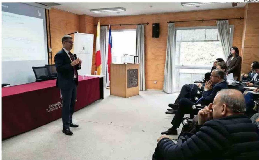
EN LA FACULTAD DE CIENCIAS ECONÓMICAS Y ADMINISTRATIVAS DE LA UACH SE LLEVÓ A CABO LA PRESENTACIÓN DEL IPoM SEPTIEMBRE 2024.

celebró el 7 de septiembre la Facultad de Ciencias Económicas y Administrativas de la UACH y en ese marco se realizó ayer la presentación del IPoM en sus dependencias.