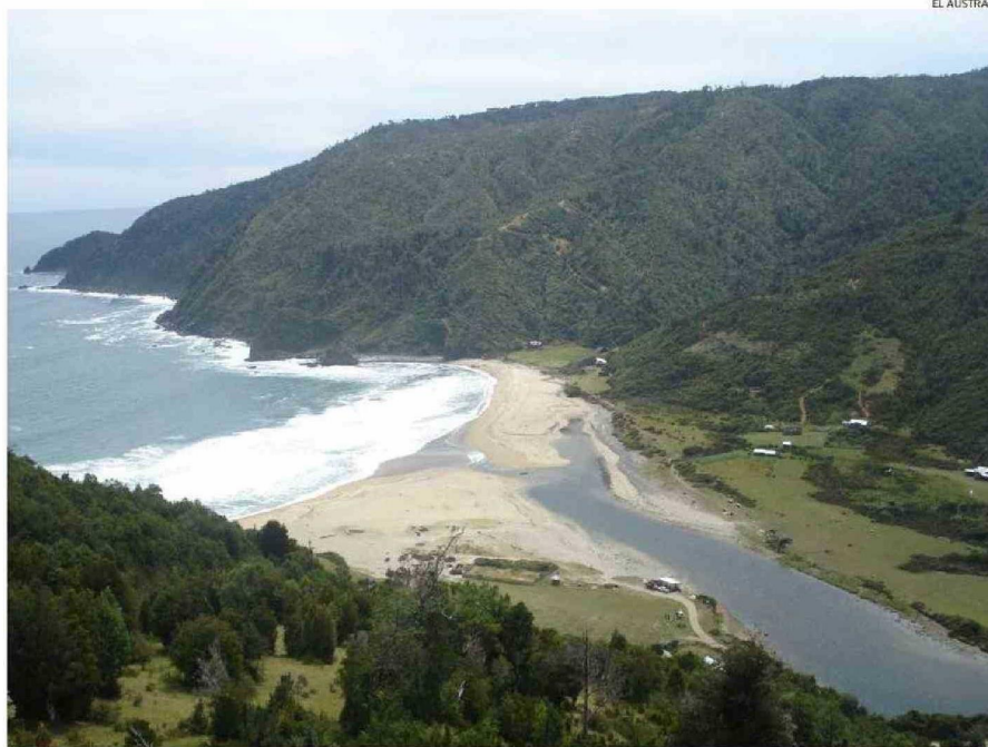
EL TERRITORIO DE MAPU LAHUAL ES RECONOCIDO POR LA CONSERVACIÓN DE SUS BOSQUES Y LA PUREZA Y TRANQUILIDAD DE SUS PLAYAS.

“Soy operador turístico y guía, pero al mismo tiempo tengo un camping en la comunidad de Manquemapu, donde vivo. En toda la red de Mapu Lahual hay hospedajes, servi-