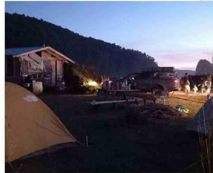
LA IDEA ES QUE EL TERRITORIO SIGA CONSERVANDO SU NATURALEZA.

“Ya no se hacen tantas tejuelas como antes, pero sí todavía existe ese trabajo, que tal