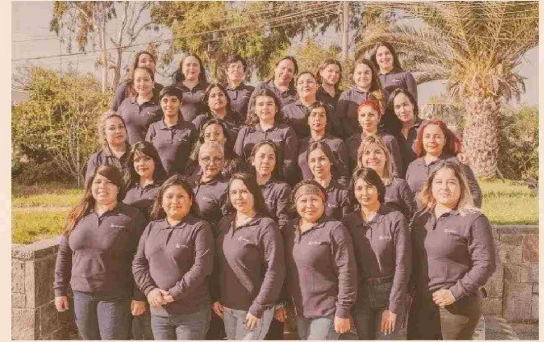
En Orica, es vital crear espacios donde las mujeres puedan expresarse libremente y compartir sus historias; proporcionarles las herramientas y recursos necesarios para que crezcan profesionalmente y alcancen sus metas es primordial. Su compromiso es crear un entorno donde todas las mujeres puedan prosperar y hacer realidad sus aspiraciones profesionales.

Para obtener más información sobre la Escuela de Operadoras y otras iniciativas de diversidad de género en Orica, visite https://www.orica.com/