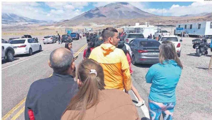
HASTA 6 HORAS DE ESPERA TUVIERON LOS VISITANTES EN EL PASO SAN FRANCISCO DURANTE EL MARTES.