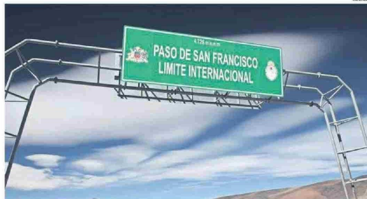
SE ESTIMA QUE MÁS DE MIL PERSONAS CRUZARON ESTE MARTES POR LA FRONTERA ATACAMEÑA.