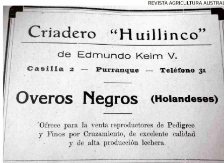
AVISO DEL CRIADERO "HUILLENCO" DONDE SE OFRECÍAN REPRODUCTORES.

crianzas estaban concentradas en los alrededores de Osorno y Valdivia.