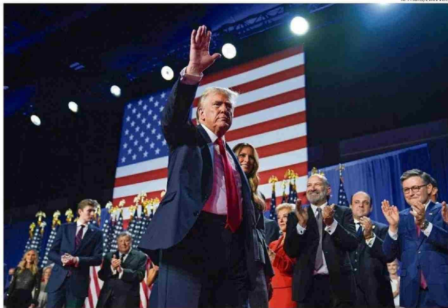
DONALD TRUMP FESTEJÓ EN FLORIDA JUNTO A SU ESPOSA MELANIA Y SUS COLABORADORES.

“Mucha gente me ha dicho que Dios salvó la vi-