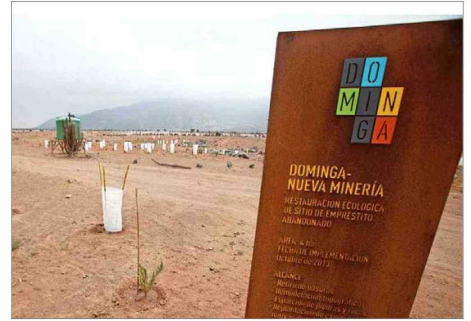
Es tercera vez que un Comité de Ministros se pronunciará sobre el proyecto minero-portuario Dominga.

En este sentido, quien debiese asistir a la reunión por parte de la cartera de Salud es la subsecretaria de Salud Pública, An-