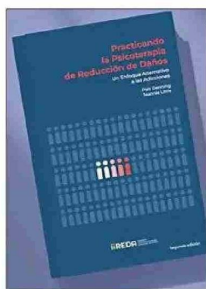
El libro “Practicando la psicoterapia de reducción de daños” fue traducido por primera vez al español.

Las expertas están de visita en Chile para participar de las actividades enmarcadas en el seminario “Drogas y salud pública”, organizado por el Instituto Iberoamericano de Reducción de Daños (iiREDA) y el Servicio Nacional para la Pre-