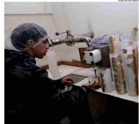
COLMENARES RALÚN TIENE UNA MODERNA PLANTA DE ENVASADO.