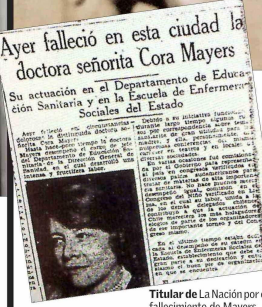
Titular de la Nación por el fallecimiento de Mayers.