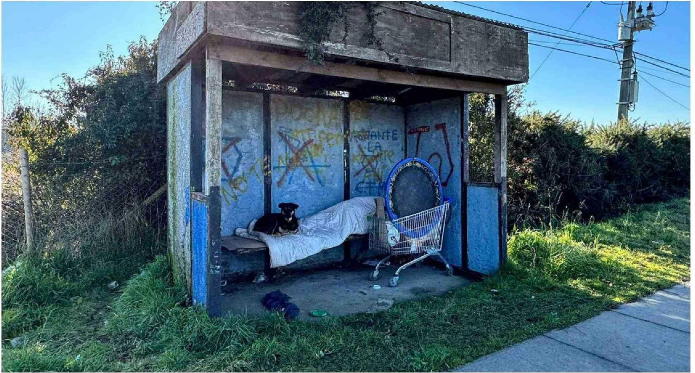
ESTA IMAGEN FUE CAPTADA AYER EN LA MAÑANA CUANDO LA TEMPERATURA ERA DE UN GRADO BAJO CERO. ESTA PERSONA EN SITUACIÓN DE CALLE ACOMPAÑADA DE SU MASCOTA, PERNOCTA EN ESTA PARADA EN LA RUTA 7.