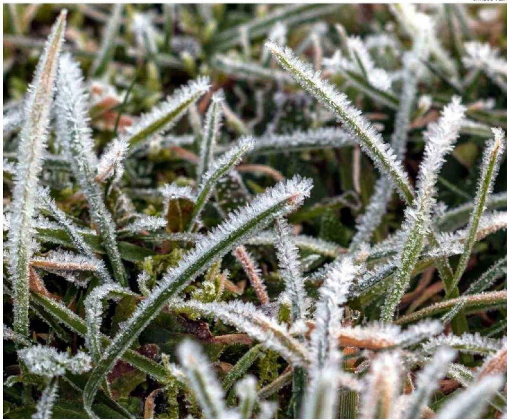
EL CÉSPED ESTABA BLANCO AYER EN LAS PLAZAS DE PUERTO MONTT.