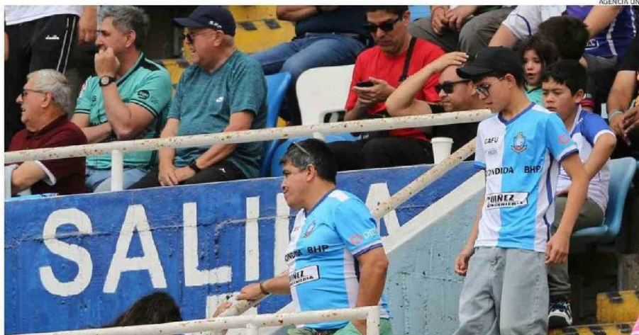
UN PROMEDIO DE 1.980 ESPECTADORES LLEVARON LOS PUMAS EN 2024. FUE LA SEXTA PLAZA DE LA PRIMERA B.