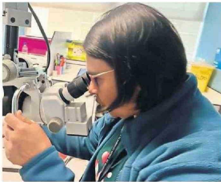
ANTIGUAMENTE SE TRASLADABA A ANTOFAGASTA A LAS MUJERES PARA PRACTICARSE ESTE PROCEDIMIENTO.

“Nosotros comenzamos a hacer las consultas de patología cervical en agosto del 2022 y luego tuvimos que esperar bastante tiempo hasta octubre de este 2024 para tener la autorización del Ministerio