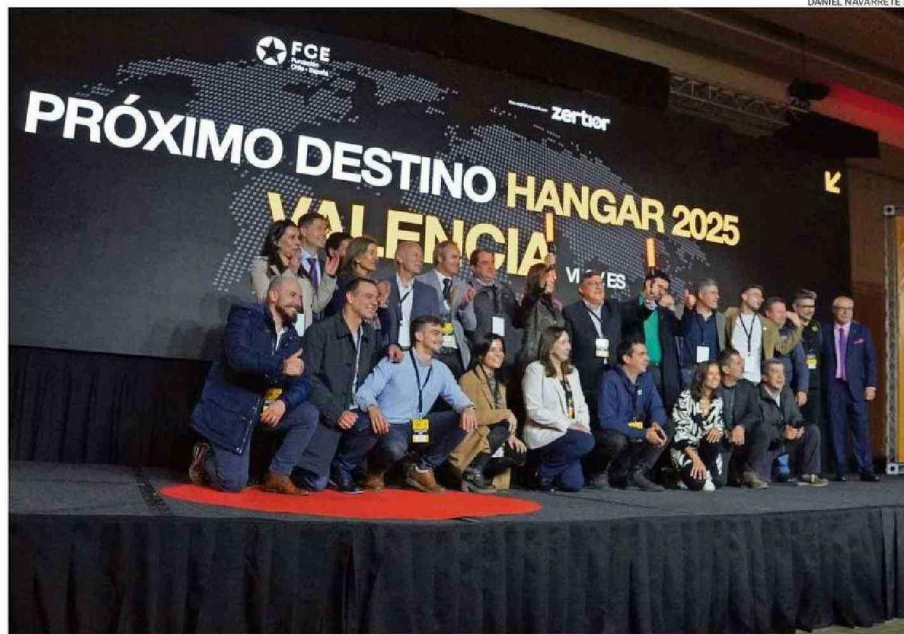
EN DEPENDENCIAS DEL HOTEL DREAMS FUERON LOS DOS DÍAS DE ACTIVIDADES QUE FINALIZARON AYER POR LA TARDE.