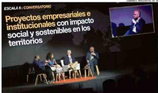
LA FACULTAD DE CIENCIAS DE LA INGENIERÍA UACH ESTUVO PRESENTE EN UNO DE LOS CONVERSATORIOS REALIZADOS AYER EN LA MAÑANA.

tencialidades específicas de cada territorio. La descentralización también permite una mejor adaptación a los desafíos globales, potenciando el comercio entre naciones y la implementación de iniciativas de vanguardia que apunta a lograr un desarrollo sostenible y al uso responsable de los recursos naturales”.