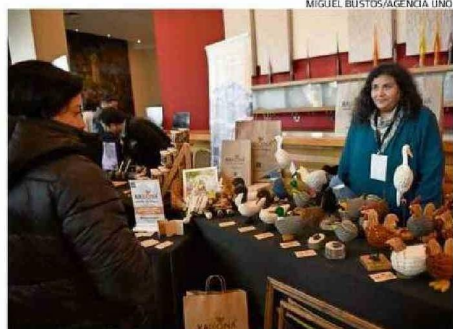
HANGAR 360 TUVO STANDS DE STARTUPS Y EMPRESAS VALDIVIANAS.

los recursos del royalty minero para, precisamente, potenciar la región. Por lo tanto, desde mi punto de vista, las comunidades tienen que trabajar en conjunto con sus próximas autoridades elegidas para implementar mecanismos que puedan incentivar que las startups puedan venir a desarrollarse a esta ciudad y a esta región”, puntualizó el timonel de la CPC.