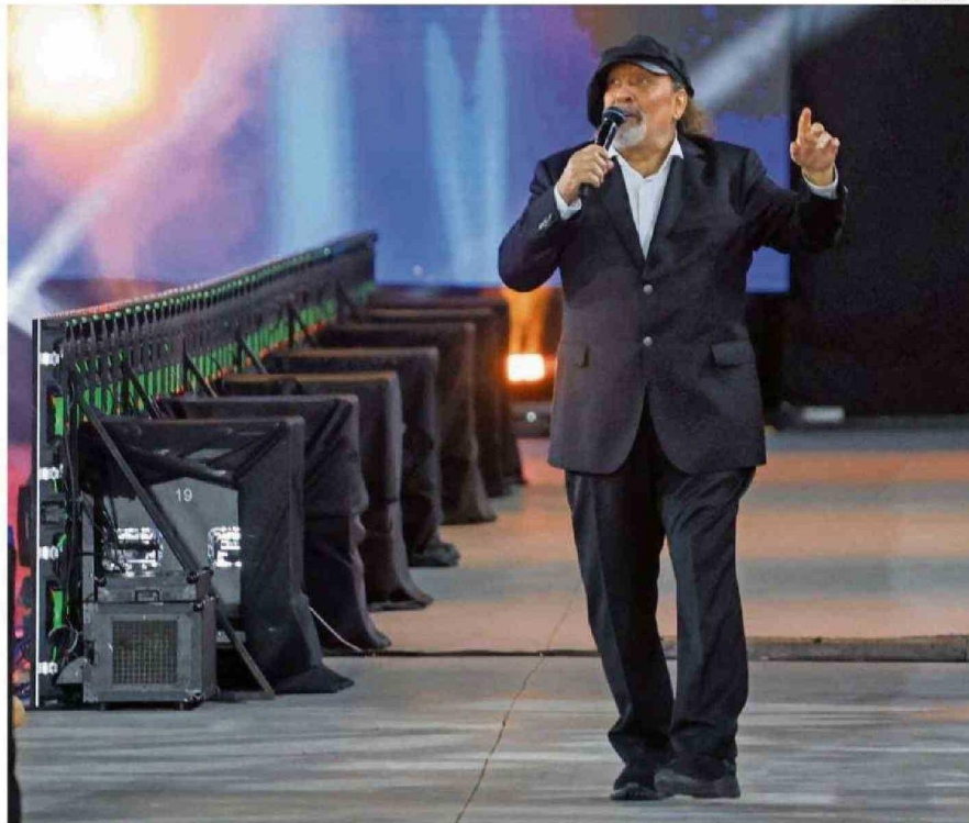
LA GALA DEL FESTIVAL DE VIÑA FUE LA ÚLTIMA APARICIÓN EN TELEVISIÓN DE MIGUEL PIÑERA LA SEMANA PASADA.

En palabras de él mismo, lo pasó "chanchito" en la Unidad Popular. A pesar de no ser alguien ligado a la política (tanto de izquierda como de dere-