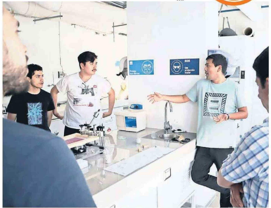
UNIVERSIDADES ENSEÑAN A ESTUDIANTES RESPECTO A TECNOLOGÍAS QUE SE PUEDEN DESARROLLAR CON BASE A SEMICONDUCTORES.

En los últimos años, Chile ha logrado avances significativos en la investigación y el diseño de circuitos de microelectrónica. Este progreso ha sido