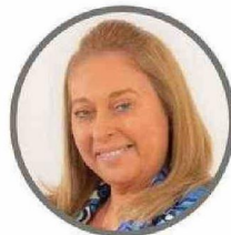
Gilda Mendoza Vásquez Renovación Nacional I-104

Va por su último periodo para seguir dando pasos importantes en materia de seguridad, cultura, deportes y en las diversas áreas, en coordinación con la comunidad, dirigentes y municipios. "Durante este periodo tuve el honor de presidir la Comisión de Seguridad Ciudadana y Bomberos realizando una inversión histórica. Destaco el financiamiento sin precedentes para Bomberos, Carabineros, las Policías, municipios, Gendarmería y organizaciones sociales en materia de infraestructura pública, adquisición de vehículos, fondos concursables y programas para la seguridad".