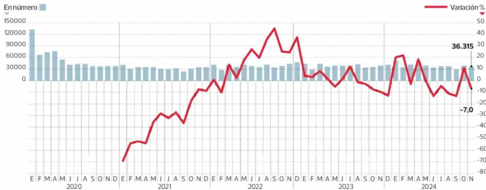
Despidos por necesidad de la empresa