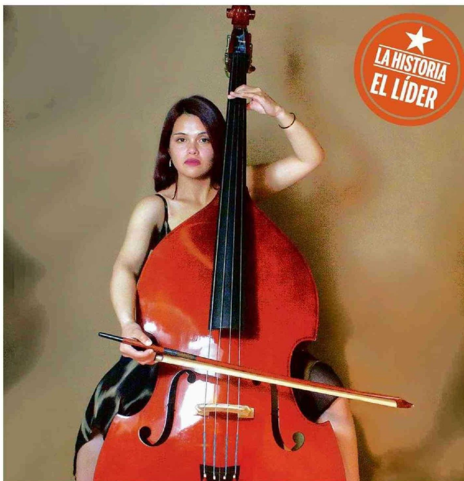
“LO QUE YO QUIERO ES LEVANTAR LA ESCENA MUSICAL EN SAN ANTONIO, PORQUE ESTÁ APAGADA”, DICE LA CONTRABAJISTA.

“Lo que me cautivó del contrabajo es su sonoridad, gravedad, grandeza y la importancia que tiene