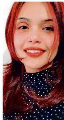
LA ARTISTA TIENE 28 AÑOS.