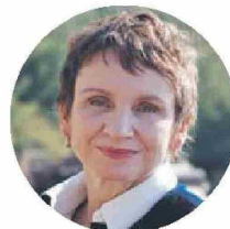
CAROLINA TOHÁ , ministra del Interior.