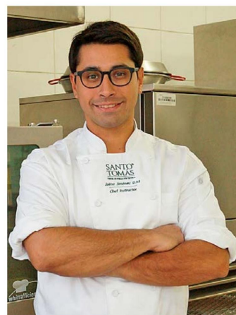
Por: Jaime Jiménez De Mendoza Dir. de Carreras del Área de Turismo y Gastronomía CFT Santo Tomás, sede Rancagua

La mesa de Sewell convocada por las cocineras simbolizaba unión, solidaridad,