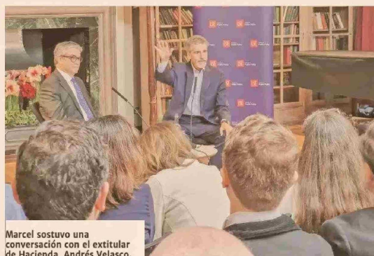
Marcel sostuvo una conversación con el ex titular de Hacienda, Andrés Velasco.

Usando como referencia la discusión de la ley corta de isapres, el ministro recordó que “tardamos