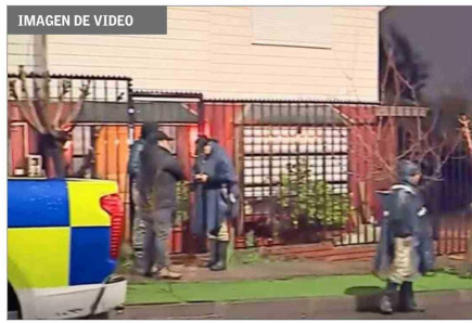
"TURBAZOS". — El fenómeno de robos violentos a viviendas se ha hecho más frecuente en el último tiempo, principalmente, en la RM. El último ocurrió la madrugada de ayer, en La Florida.

Por su parte, el exsubsecretario del Interior Felipe Harboe ve los cambios informados por el INE como "positivos, en cuanto actualizan el instrumento y si el INE certifica comparabilidad no creo que haya mayor cuestionamiento. Sin perjuicio de esto, es evidente que tenemos nuevas preguntas que permitirán a partir de este año tener más información sobre la criminalidad y violencia en Chile".