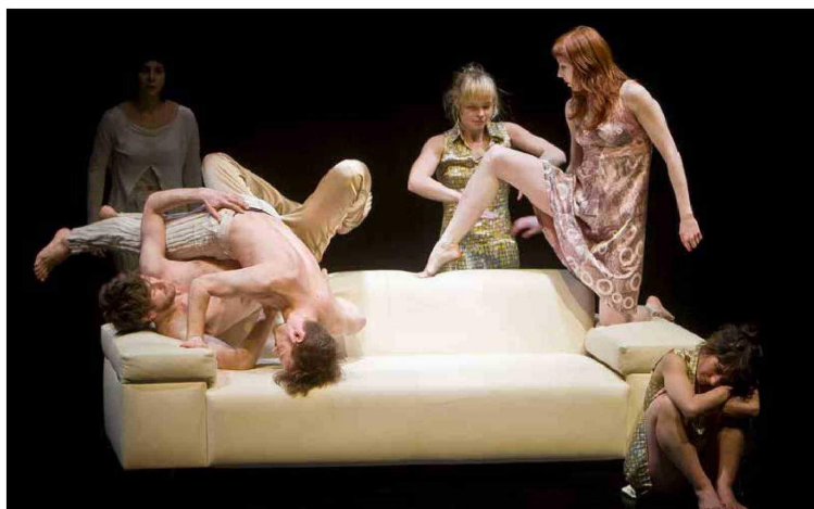
Los sueños lúcidos tienden a recordarse y su característica principal es que la persona es consciente de que está soñando, por lo que podrá controlar el sueño o no, pero lo fundamental es esa consciencia durante el sueño. En la imagen, bailarines de la Compañía de Michèle Noiret y los Percusionistas de Estrasburgo, que recrean el ambiente de pesadilla de las obras de Kafka, en el Teatro Central de Sevilla, (junio de 2022).

Todo el mundo sueña y soñamos, en general, pero no recordamos todos. Tendemos a recordar los sueños más próximos a la fase REM que representa el 25% del ciclo de sueño y que se puede dar varias veces durante el estado de sueño. Se considera que una tercera parte de nuestra vida la pasamos dur-