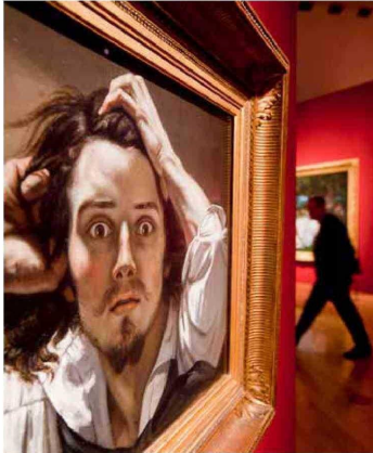
Hay una parte del contenido de los sueños que puede tener relación, o no necesariamente, con lo que hemos vivido. Pueden ser motivados por noticias que nos han provocado un miedo que surja a raíz de algo que hemos visto y que, luego, podemos adoptar en el sueño de otra forma. En la imagen, "Autorretrato - El hombre desesperado" (1844/45), del artista francés Gustave Courbet, en el museo Schirn de Fráncfort (Alemania).

Tiraje: 5.000 Lectoría: 15.000 Favorabilidad: No Definida