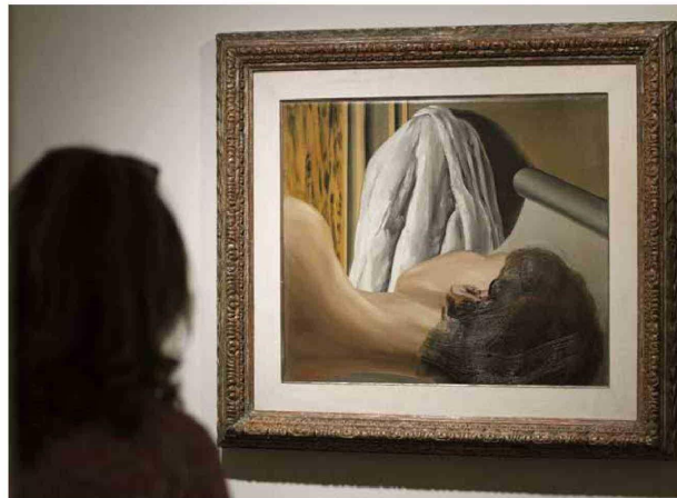
Los sueños son una fantástica fuente de inspiración para los artistas y un mundo paralelo en el que se proyectan de forma simbólica, y muchas veces surrealista, nuestros problemas y emociones. En la imagen, una visitante observa la obra "La prueba del sueño" (1926) de René Magritte, que forma parte de la exposición "El surrealismo y el sueño" que ofreció el Museo Thyssen-Bornemisza de Madrid.

general, los sueños en sí, aunque sirven como experimento a nivel científico, son un fenómeno natural donde el cerebro en ese momento está desconectado del entorno porque no estamos percibiendo nuestro alrededor, al menos de manera 100 % consciente, y generan por sí mismos un mundo de experiencias fascinante. Y entre ellos, los sueños lúcidos, donde es relativamente más frecuente ser consciente, aunque no tanto poder controlarlos, resultan un estado intermedio entre el sueño y la vigilia".