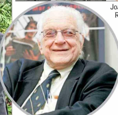
Arnold Harberger es un reconocido profesor de los departamentos de Economía de la Universidad de Chicago y UCLA, quien además fue mentor de destacados economistas chilenos.