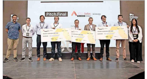
AIwater, EFLabs y Alicia fueron los proyectos ganadores de la quinta versión de 100+ Labs Chile, impulsado por Cervecería AB InBev.

Según explicaron ejecutivos de Cervecería AB InBev, los tres proyectos ganadores tendrán la posibilidad de acceder a un fondo de 30 millones de pesos a repartir, además de una serie de mentorías especializadas junto con comenzar un piloto de sus casos de negocios tanto con Cervecería AB InBev como en Coca-Cola Andina y Coca-Cola Emborner.