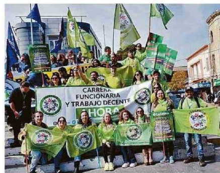
HOY A LAS 10 DE LA MAÑANA HARÁN DENUNCIA Y CONFERENCIA.