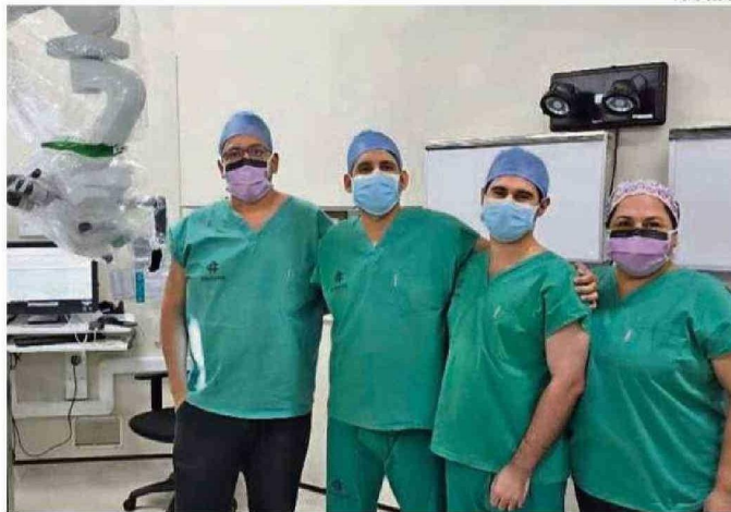
EQUIPO DE CLÍNICA ALEMANA DE TEMUCO QUE PARTICIPÓ EN EL HITO REGIONAL DE EFECTUAR LA PRIMERA CIRUGÍA DE REVERSIÓN DE VASECTOMÍA, INTERVENCIÓN DE ALTO NIVEL DE COMPLEJIDAD Y ESPECIALIZACIÓN.

"El perfil más frecuente de la persona que se quiere revertir es alguien que ya tiene hijos, que se hizo la vasectomía y el día de mañana con una nueva pareja, opta por tener hijos nuevamente".