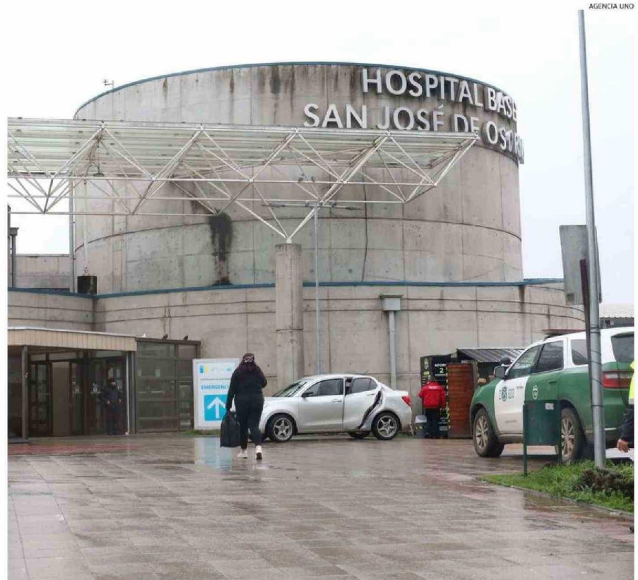
EL HOSPITAL BASE CONCENTRA GRAN PARTE DE LAS ATENCIONES POR ENFERMEDADES RESPIRATORIAS EN ESTAS SEMANAS.

No obstante, a pesar de que se han pesquisado pocos casos de influenza, desde el Servicio de Salud (SSO) advierten que los contagios podrían aumentar en las próximas semanas, por lo que es muy importante inocularse con la vacuna con-