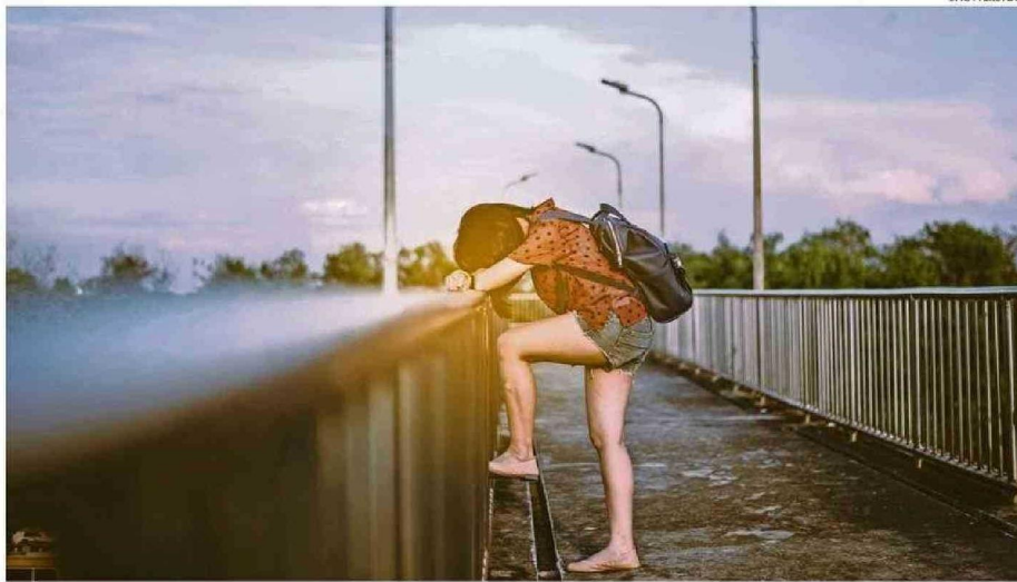
LA ORGANIZACIÓN MUNDIAL DE LA SALUD (OMS) ASEGURA QUE EL SUICIDIO ES UN PROBLEMA DE SALUD PÚBLICA A NIVEL GLOBAL.