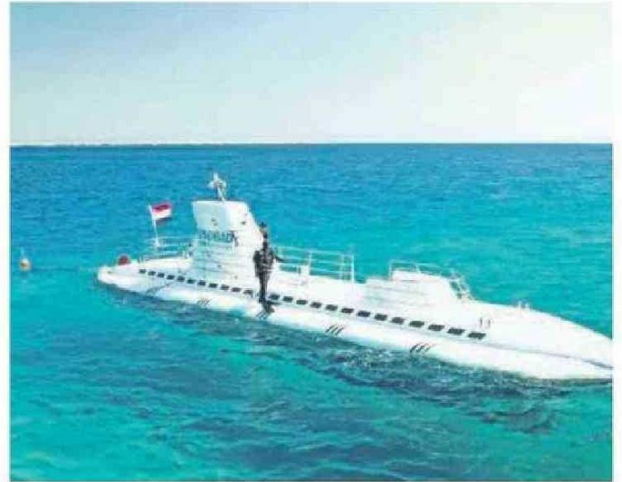
El crucero iba por los arrecifes de coral del Mar Rojo.

"Yo mismo he ido a bordo de este submarino y el nivel de seguridad es alto, es muy bueno", dijo.